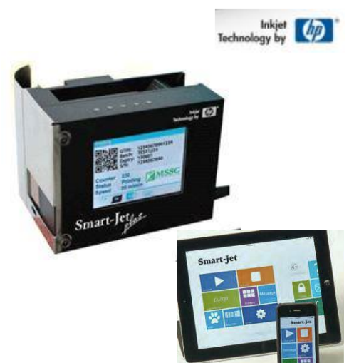
Abb. Steuerung des Smart-Jets z.B. auch mit Smartphone-App