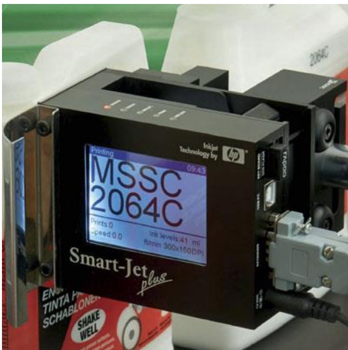
Abb. Kunststoffflaschen im Durchlauf mit der im Smart-Jet eingebauten HP-Druckeinheit gekennzeichnet