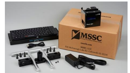
Einsatzbereites Startpaket mit Montage-, Anbauhalterungen, Lichtschranke, Eingabetastatur und Netzgerät.