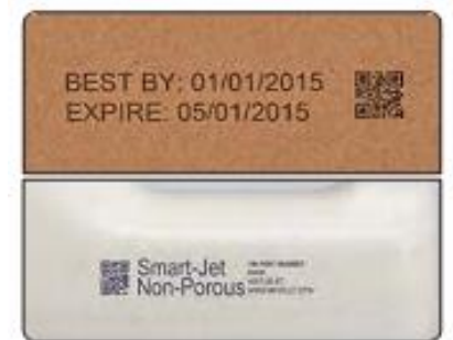
Druckmuster auf Karton- und Folienpackungen bis zu 300 dpi