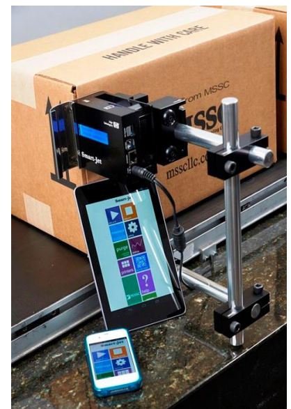
Modernste Bedienung und Steuerung via Netzwerk, PC oder Tablett