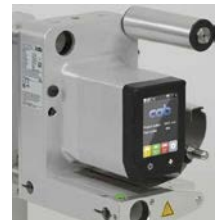
Intuitiv geführter Berührungsbildschirm