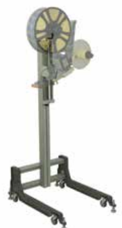
Stativ fahrbar mit feststellbaren Rollen