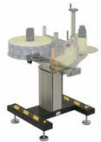
Stativ mit elektrisch einstellbarer Höheneinstellung