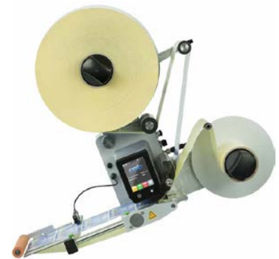
IXOR Spendeinheit mit Kompaktsteuerung