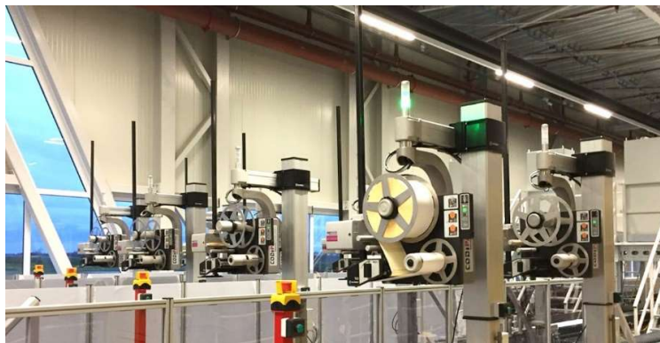
Logistikzentrum Installationen mit Kapazitäten von 1500 Paketen/Std.