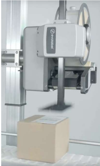
QuickTamp im Einsatz