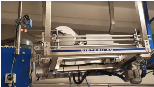
Etiketteneinlegestation in 2m Höhe