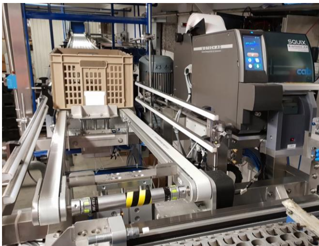
Befördern der Gebinde auf Höhe des Druckers