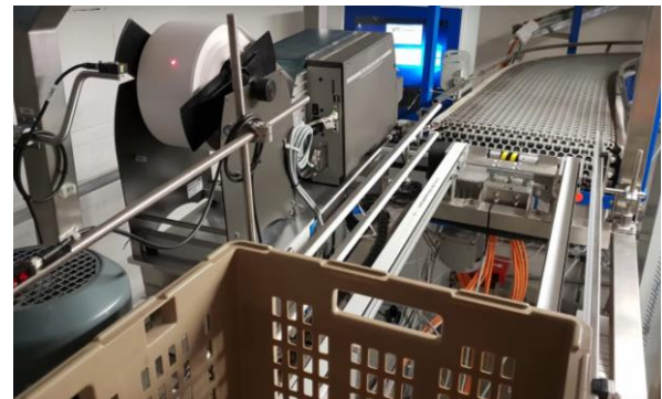
Auf Förderband geführte Kunststoff-Gebinden